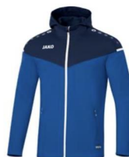
Jas met kap Junior: €37,99 Senior: €44,99