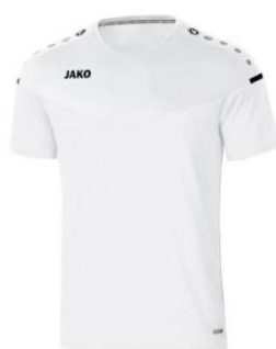
T-shirt Junior: €18,49 Senior: €22,49