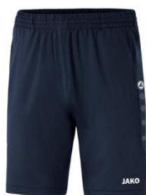
Short premium Junior: €17,49 Senior: €20,99