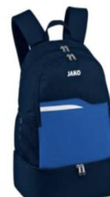
Rugzak 1 maat: €22,49