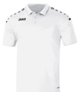
Polo Junior: €22,49 Senior: €26,49

Mocht je meer vragen hebben met betrekking tot de clubkleding, neem contact op met zwemmen@dzpc.nl