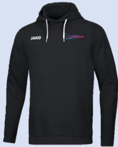
Hoodie Maat 126-164 en S-4XL